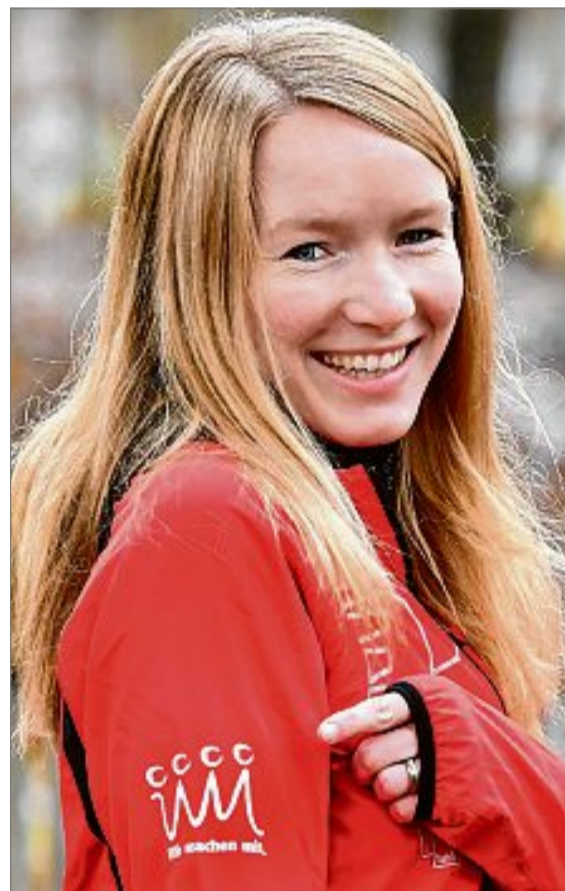
Die Laufabteilung des TuS Deuz unterstützt mit einem Ärmellogo das Projekt „Wir machen mit. Inklusion läuft!“